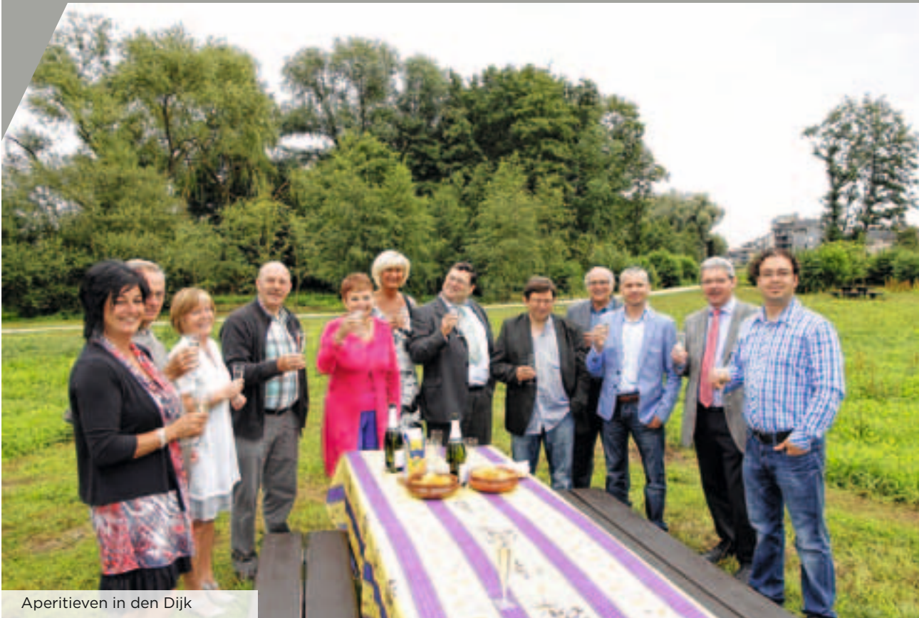
Aperitieven in den Dijk

Een deel van de bestuursleden van CD&V genoten alvast van een lekkere aperitief in dit natuurlijke kader.